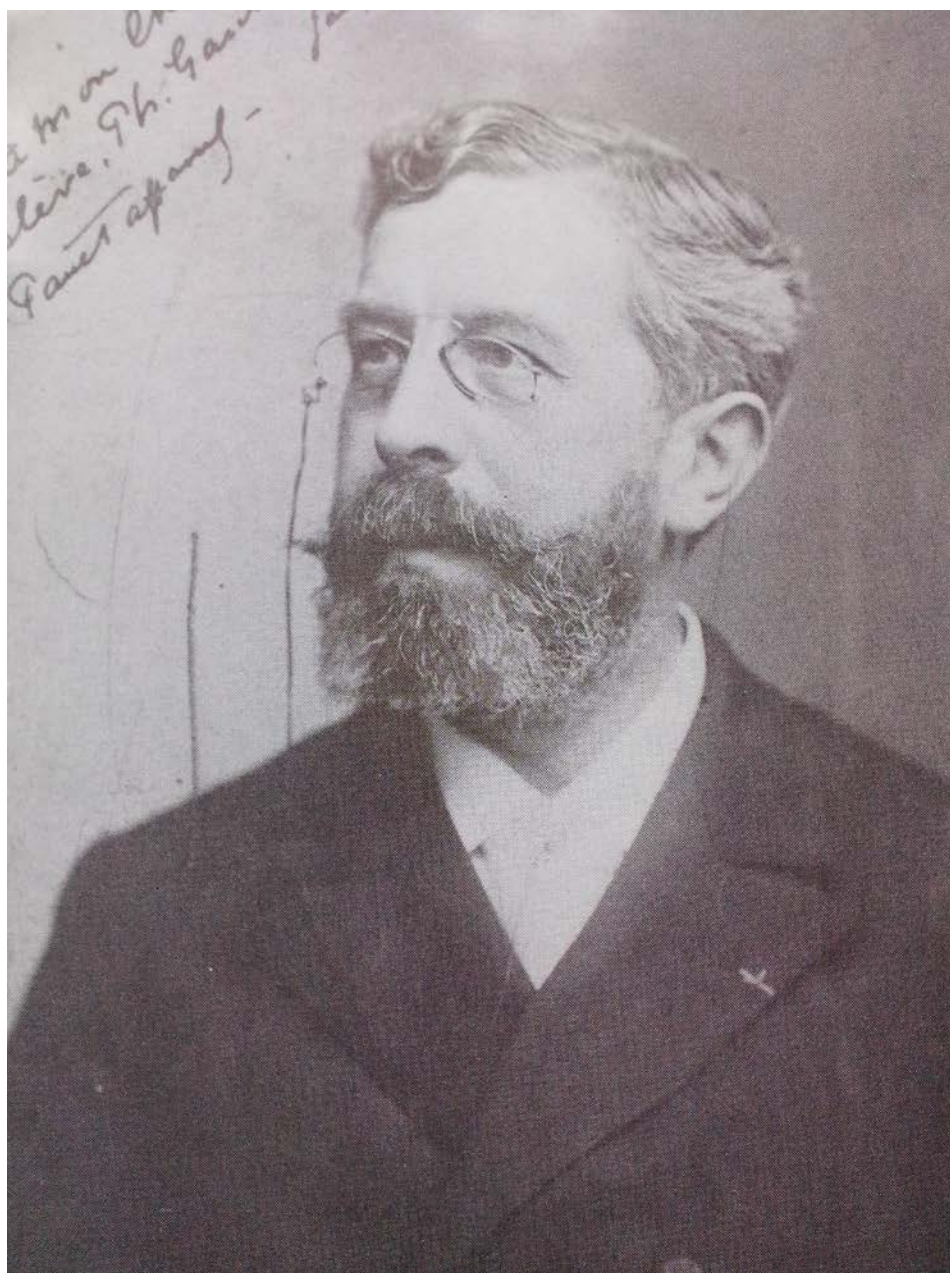
Taffanel portréja, Philippe Gaubert-nek dedikálva - 1895