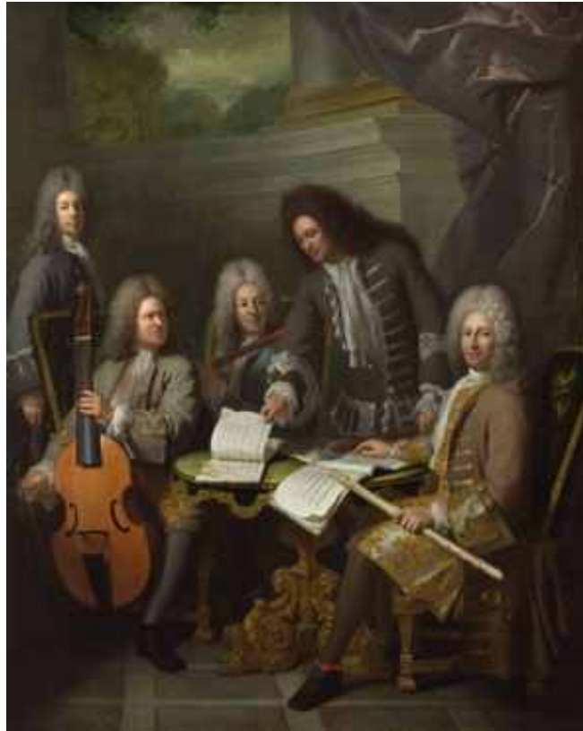
2. André Bouys: Zenészek találkozója

musiciens (Zenészek találkozója) című képen, 11 amely ma a londoni Nemzeti Galériában (National Gallery) tekinthető meg (2. kép).